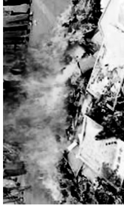
Myndighetene brenner Falun Gong materiale

Den tidligere kinesiske lederen ga ordre om å utrydde Falun Gong i løpet av 3 måneder: Ødelegg deres anseelse, ødelegg dem finansielt, ødelegg dem fysisk. Hans forbrytelser rammes av internasjonale lover. Jiang er saksøkt i flere land. Det samme gjelder lederne for 6-10 kontoret og flere av Jiangs medarbeidere. Noen er allerede funnet skyldige i retten.